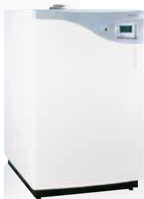
Modèle chauffage seul